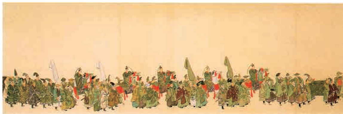
明治天皇行幸繪卷 (氷川神社蔵)