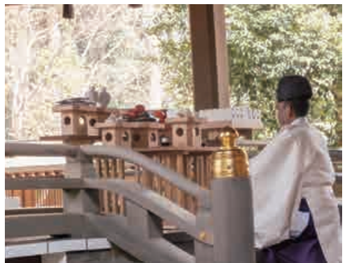
埼玉県煎茶道連盟献茶式(3月20日)